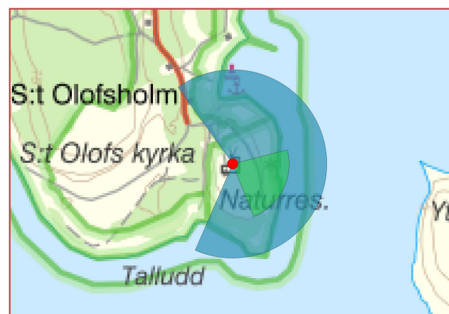
Grön: Fotomontage, Blå: Symbolmontage