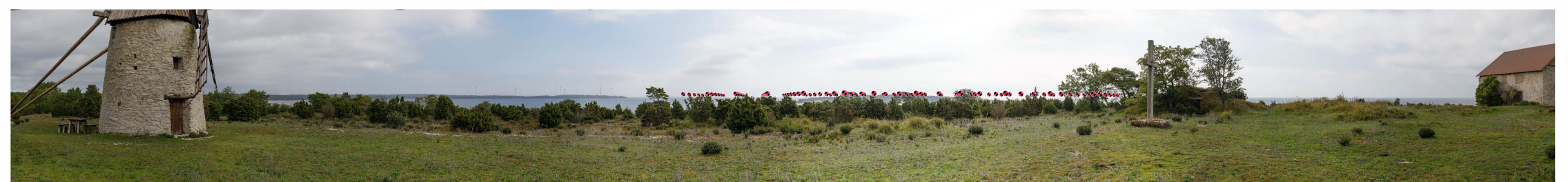
Symboler som visar vindkraftverkens placering. Avstånd till närmsta vindkraftverk är cirka 17 km