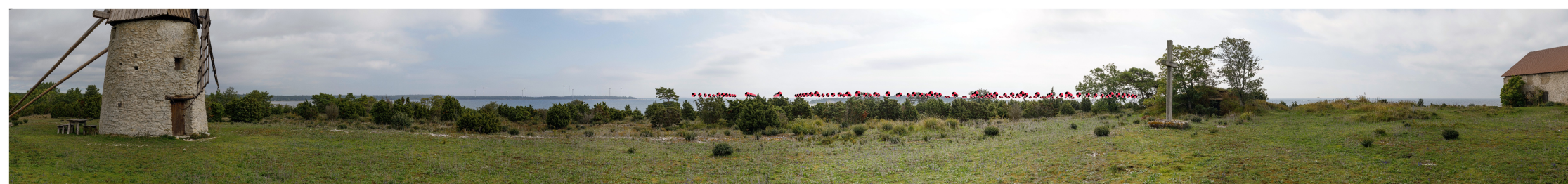
Symboler som visar vindkraftverkens placering. Avstånd till närmsta vindkraftverk är cirka 17 km