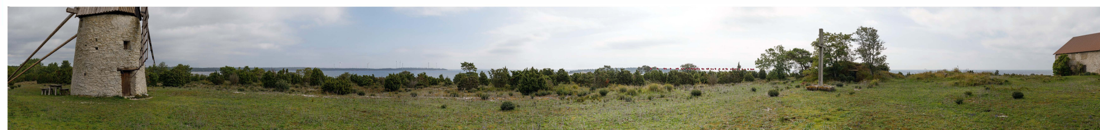
Symboler som visar vindkraftverkens placering. Avstånd till närmsta vindkraftverk är cirka 47.8 km